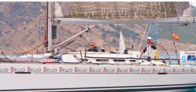
El Brujo, vencedor de las 200 Millas a2, 2014. La embarcación también ganó en 2005 y 1999.

Este año los ganadores se llevan un premio de peso. El primer clasificado recibirá dos lingotes de un kilo de plata, el segundo dos lingotes de medio kilo y el tercero dos lingotes de un cuarto de kilo de plata.